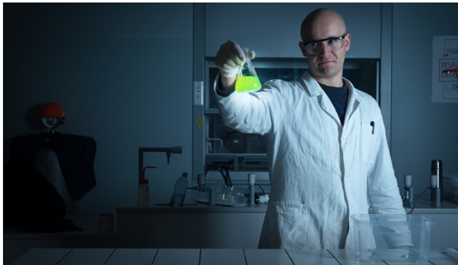
Ook scheikundigen in een groot bedrijf worden geacht maatschappelijke ontwikkelingen en belangen in hun handelen mee te laten wegen