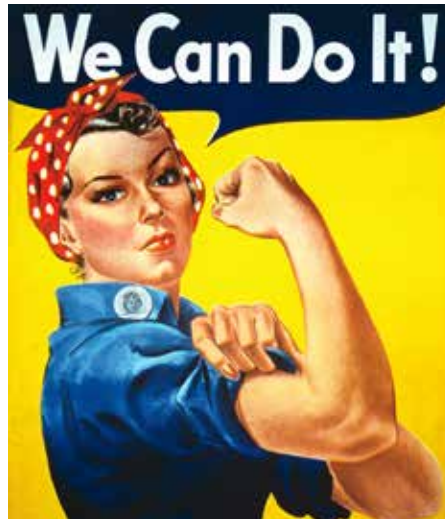
Illustratie: J. Howard Miller (National Museum of American History)

Bij maatschappijwetenschappen vragen we ons af waarom de samenleving eruit ziet zoals die eruit ziet. We kijken niet alleen naar de Nederlandse samenleving, maar we vergelijken die ook met andere