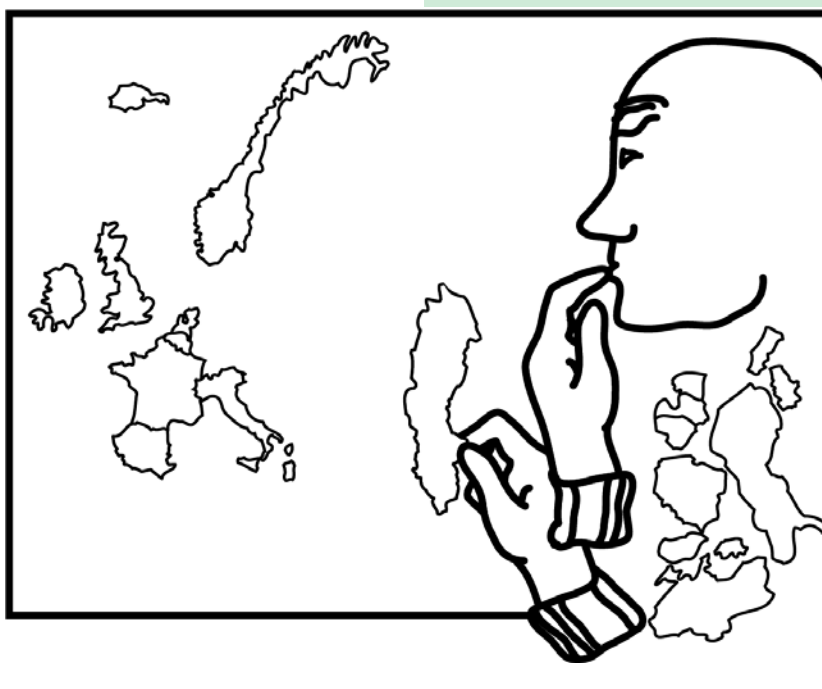
Illustratie: Anneke Gast

De twee tutoren van elke groep beoordelen de leerlingen met een individu-