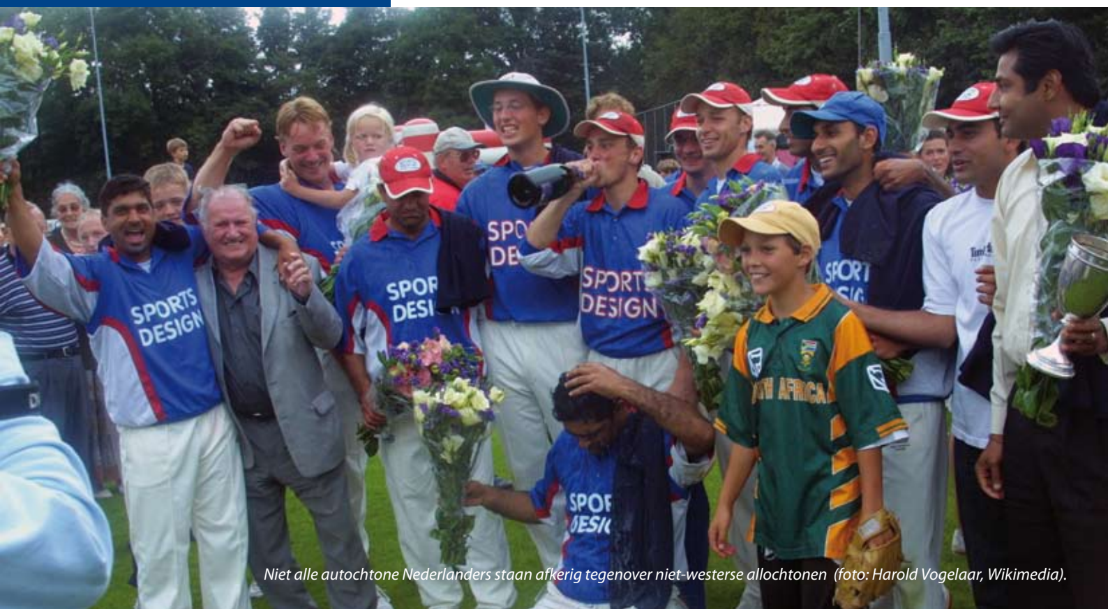
Niet alle autochtone Nederlanders staan afkerig tegenover niet-westerse allochtonen.

Alles wat men over andere groepen hoort van mensen die men tot de eigen groep rekent slaat men op en verwerkt men tot stereotypen. Bij dit categoriseringsproces idealiseert men de eigen groep. De hogere waardering voor de eigen groep stut de zelfwaardering en produceert afkeur. Het brein lijkt als volgt te redeneren: X = ideaal, dus niet-X