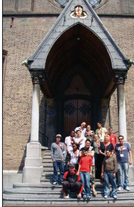
Samen in actie (Haagse Tribune): samenwerking vermindert vooroordelen.

Het onderzoek bood de gelegenheid de effecten van interetnische samenwerking op vooroordelen aan de praktijk te toetsen. De Haagse Tribune kent een project, Samen in actie , waarin twee klassen van zeer verschillende scholen in Den Haag één dag samenwerken om een maatschappelijk thema op de politieke agenda te krijgen. Daarvoor interviewen leerlingen in gemengde groepen politici en ambtenaren en maken ze filmpjes en protestborden. Wij hebben elk één van onze havo 4-klassen voor dit project opgegeven.