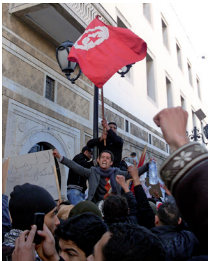
Arabische Lente begint in Tunesië