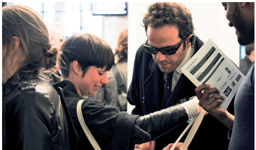
Veiligheidscontrole bij de ingang van ProDemos

De levendigste herinneringen van de bijna 80-jarige Jan Terlouw zijn die aan het laatste jaar van de Tweede Wereldoorlog. Waardoor zijn die beelden in het geheugen van de auteur van Oorlogswinter gegrift? Ongetwijfeld door het oorlogsgeweld van bijvoorbeeld de bombardementen. Het ergste was echter de willekeur van de bezetters, waaraan Terlouw een levenslange angst voor platte petten heeft overgehouden. Zijn vader werd tweemaal opgepakt om langs de IJssel mangaten te graven. Omdat zijn vader dominee was, was er altijd de dreiging dat hij als notabele zou worden doodgeschoten als represaille voor verzetsacties. Terlouw vertelt over de dilemma's die de bezet-