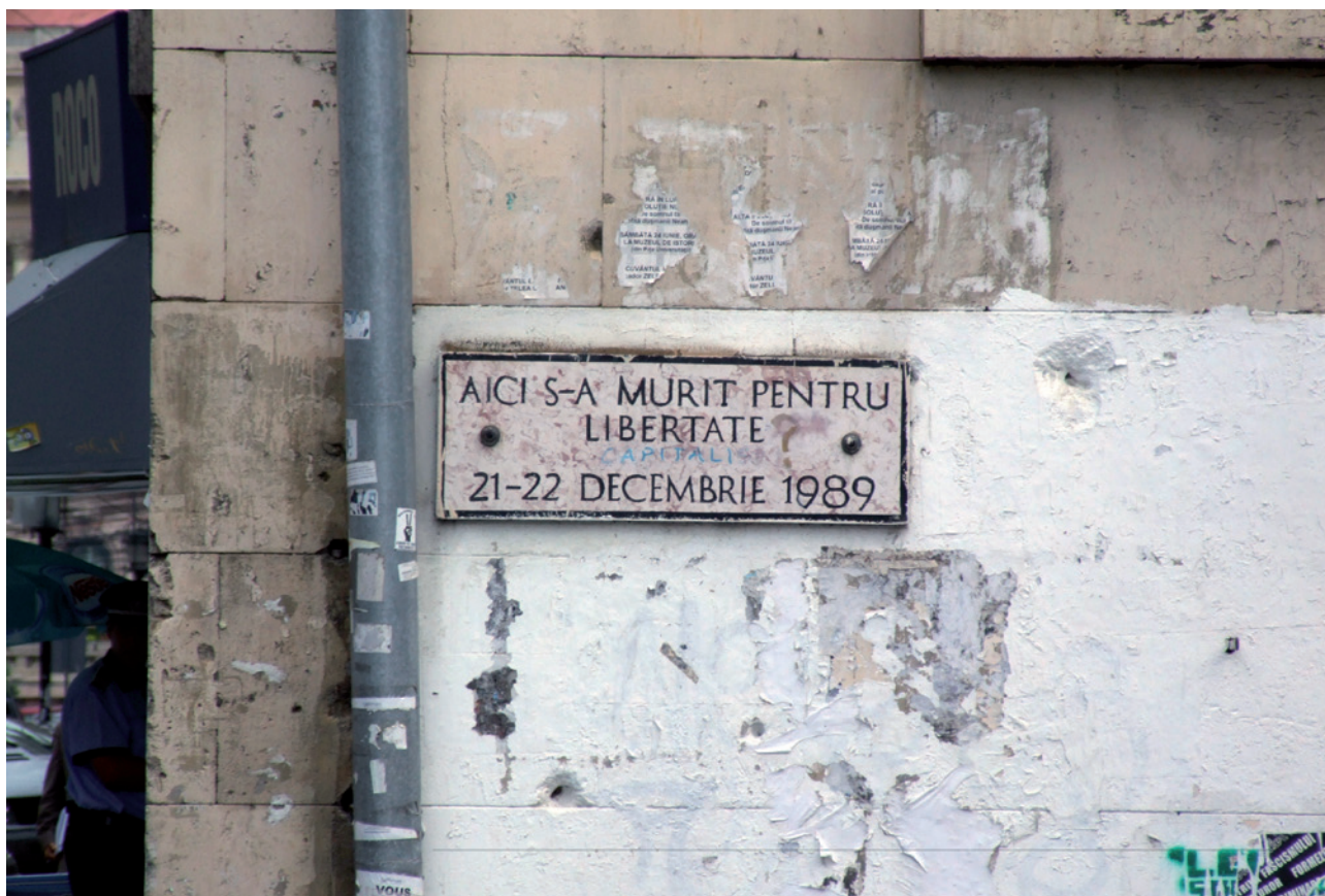
'Gestorven voor de vrijheid'. Gedenkplaat in Boekarest ter herinnering aan de Roemeense revolutie in 1989, die een einde maakte aan het dictoriaal bewind van Nicolae Ceausescu.