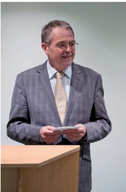
Nationale ombudsman Alex Brenninkmeijer