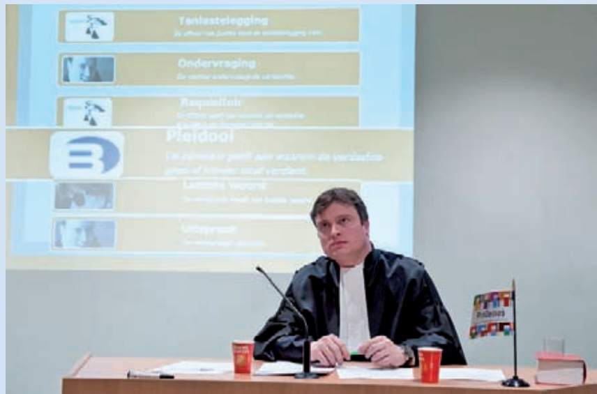
Een echte rechter tijdens de workshop

Aan het einde van de workshop werd nog een partijtje Petje op, petje af gespeeld (eveneens een lesidee). Een vraag over het constituerend beraad