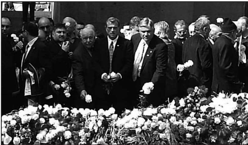
Herdenking van de Armeense genocide bij het Tsitsernakaberd-monument in de Armeense hoofdstad Yerevan.

Zij prefereren aansluiting te zoeken bij andere gruweldaden waaraan de geschiedenis zo rijk is, met name bedreven door koloniale overheersers, ook nog na 1915. Gruweldaden die vaak hadden te maken met deportaties, die gepaard gingen met ziekte en hongersnood - de belangrijkste doodsoorzaak bij de Armeense slachtpartij. Bij de volksverdrrijvingen na opdeling van Brits-Indië in India en Pakistan kwam een veelvoud van het aantal Armeense slachtoffers om, maar daarvan is zeker dat dit niet van hogerhand was gepland. Bij de Armeense moordpartij was dat vrijwel zeker wel het geval. Wel kan erop worden gewezen dat er in dezelfde tijd ook in andere grensstreken lustig op los werd vermoord. Joseph Roth