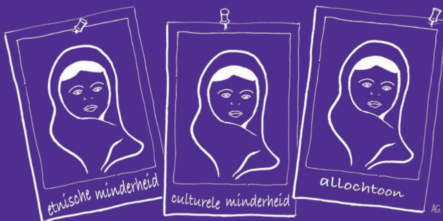
Illustratie: Anneke Gast

De eindtermen, en diensgevolge de behandeling daarvan in de maatschappijleermethoden, beperken zich vrijwel geheel tot dat multiculturele facet. Hebben we hier te maken met de metaforische toto pro pars , het geheel als beeld voor het deel, of gaat het om een poging negatieve associaties te bezweren die het begrip multiculturele samenleving vanaf het begin van de jaren negentig van de vorige eeuw bij steeds meer mensen is gaan oproepen? Een bezwering met behulp van de vervanging van dat besmet geraakte begrip door een ander, dat bij vrijwel iedereen op zijn