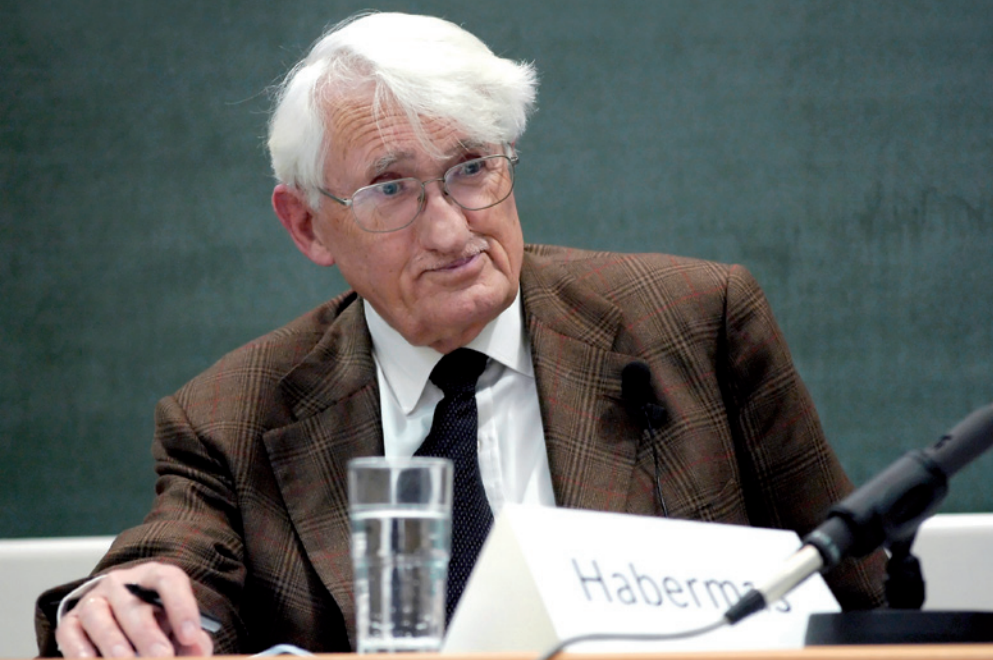
Jürgen Habermas: 'debaters moeten menen wat ze zeggen en niet liegen'