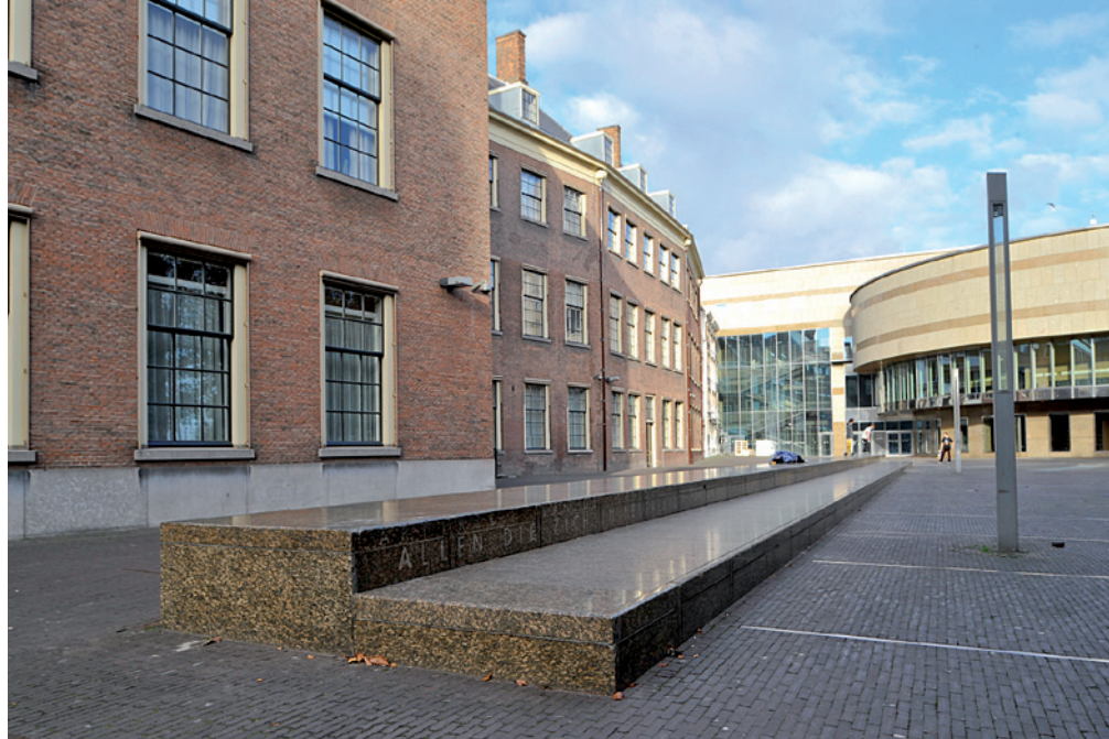
'Allen die zich in Nederland bevinden, worden in gelijke gevallen gelijk behandeld', tekst Artikel 1 gegraveerd in een monument voor het gebouw van de Tweede Kamer

In welke gevallen is sprake van discriminatie? Geen? Beide? Wel in het eerste geval, maar niet in het tweede, of andersom? In beide gevallen is duidelijk sprake van ongelijke behandeling: aan het eerste criterium is dus voldaan. Het is echter niet voldoende om tot discriminatie te besluiten. Voor het eerste geval kan worden vastgesteld dat het kenmerk op grond waarvan werd afgewezen - het dragen van een hoofddoek - volstrekt irrelevant is voor de uitoefening van de functie. Uw leerlingen zullen nu misschien zeggen dat inkomstenderving tengevolge van wegblijvende klanten wel relevant is. Dat is zo, maar die redenering gaat niet op. De klant mag dan koning zijn, maar als de klant graag discriminatie ziet, rechtvaardigt dat niet dat de winkelier discrimineert. Kortom, in het eerste geval is sprake van discriminatie en de Commissie Gelijke Behandeling zal ook zo oordelen. In het tweede geval geldt dat de griffier deel uitmaakt van de rechterlijke macht. De rechterlijke macht is niet alleen onafhankelijk, maar behoort ook onpartijdig te zijn en dat uit te stralen. Uiterlijke blijken van religieuze opvattingen zijn daarmee in strijd. Dat maakt het dragen van een hoofddoek in de gegeven situatie van uitoefening van het griffierschap tot een relevant, ongewenst kenmerk dat afwijzing van deze sollicitante rechtvaardigt. Er is dus geen sprake van discriminatie.