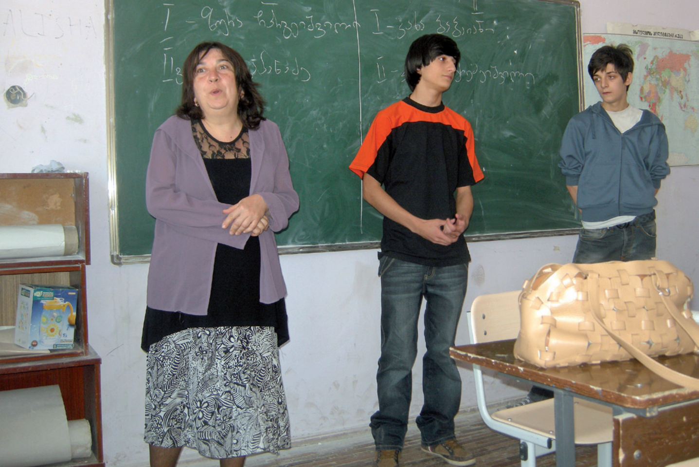
Georgische leerling verdedigt het pro-standpunt, rechts de discussieleider

bent nu heel vrij en zijn vrouw is fantastisch, maar voor werk heeft hij niet gezorgd en hij komt zijn beloften niet na. Op hem stemmen kan niet meer. Na twee termijnen is hij onverkiesbaar. Daarom moet premier Bidzina Ivanisjvili een kans krijgen', aldus de Georgische gesprekspartners, 'Ivanisjvili heeft laten zien dat hij wat kan, anders zou hij geen miljardair zijn. Hij heeft al veel voor het land gedaan: hij heeft aan kerkenbouw bijgedragen (in Georgië schieten nieuwe kerken als paddenstoelen uit de grond, met de enorme kathedraal van Tbilisi als klapstuk) en een hypermoderne brug laten bouwen; alles van zijn eigen geld'. Dankzij een klinkende overwinning van zijn partij Georgische droom bij de parlementsverkiezingen eind vorig jaar verkreeg deze vroegere bondgenoot van Saakasjvili het premierschap en de algemene verwachting is dat hij dit najaar de presidentsverkiezingen kan winnen als hij meedoet. Overigens heeft het parlement besloten dat na deze verkiezingen de politieke leiding bij de premier berust; nu heeft de president nog grote bevoegdheden. 'Hij wil ook betere relaties met Rusland, dat is goed.