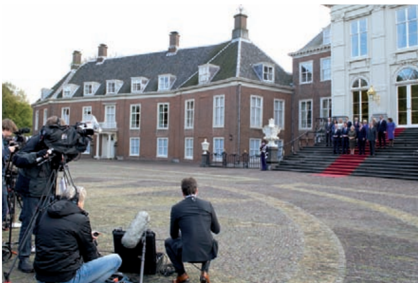
Het volk kan wel een ander kabinet willen, maar andersom niet