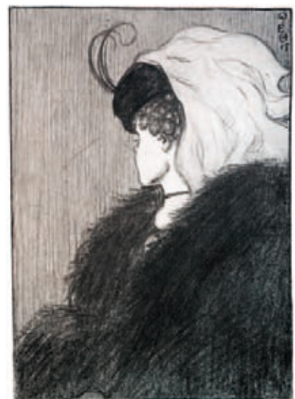
My wife and my mother-in-law