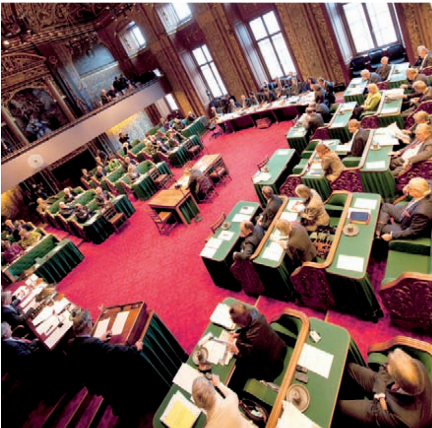
De Eerste Kamer der Staten-Generaal

'De Eerste Kamer loopt niet aan de leiband van de regering of de Tweede Kamer, maar maakt altijd een eigen afweging. Fractievoorzitters in de Tweede Kamer kunnen niet op die besluitvorming vooruitlopen. Het is goed voorstelbaar dat leden van de Eerste Kamer bij hun oordeel over de