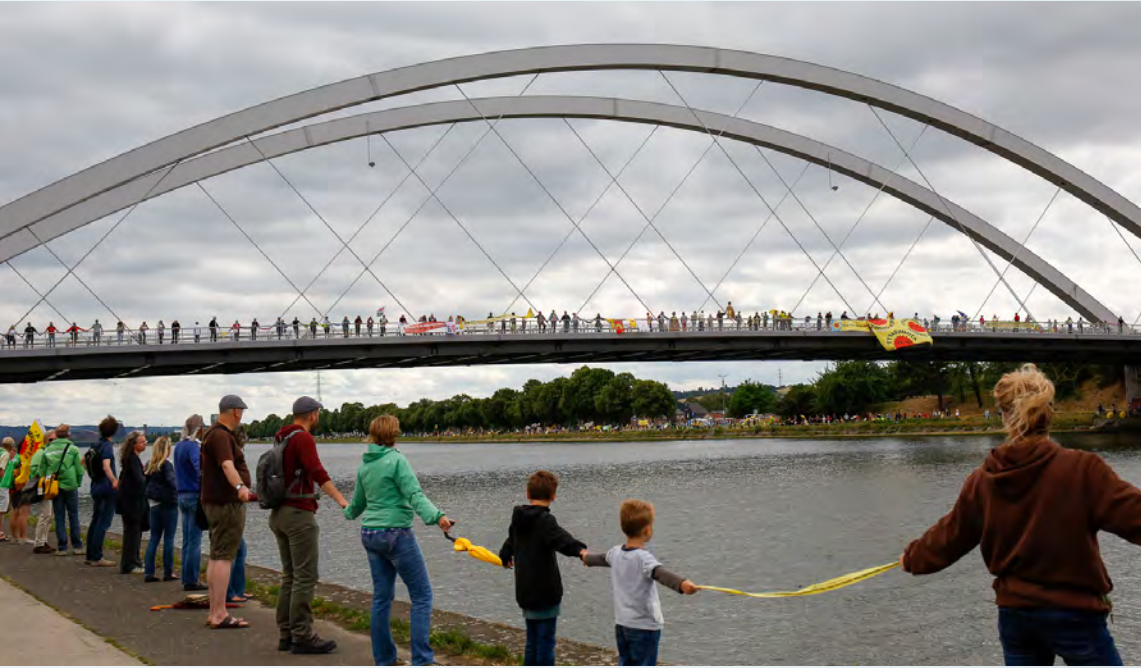
Kernenergie is nog steeds een heet hangijzer. In 2017 was er een 90 kilometer lange menselijke ketting als protest tegen de kerncentrale van het Belgische Tihange