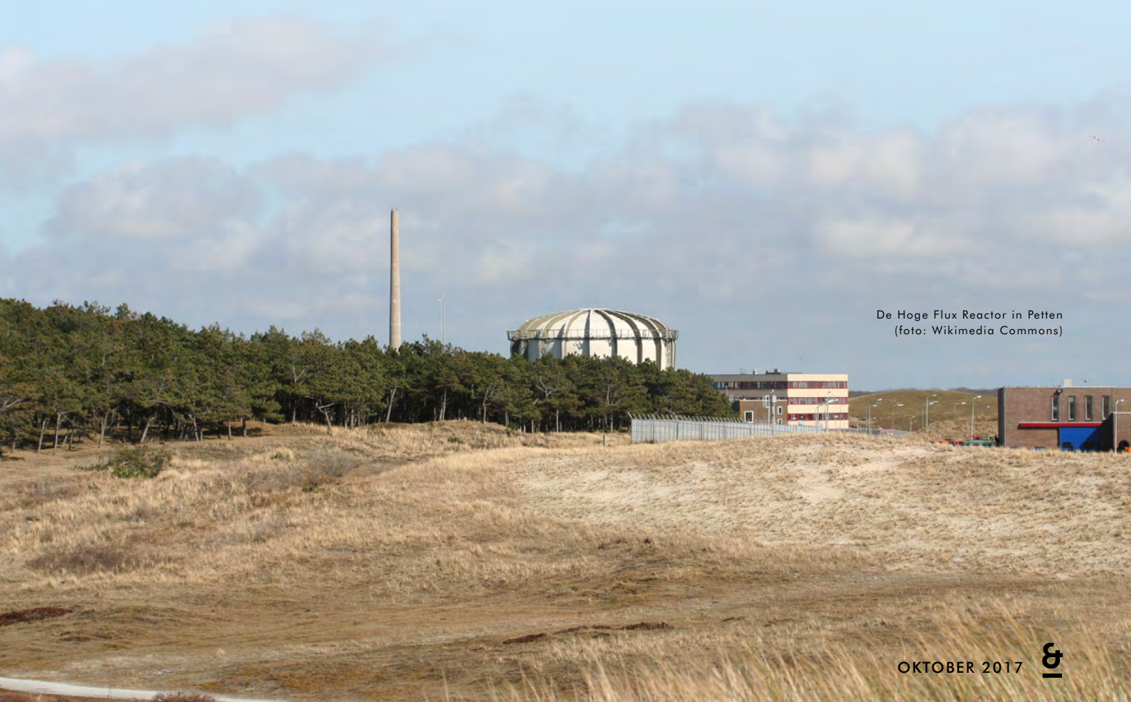
De Hoge Flux Reactor in Petten

Laurence Guérin is onderzoeker bij TechYourFuture en practor Burgerschap bij het roc van Twente.