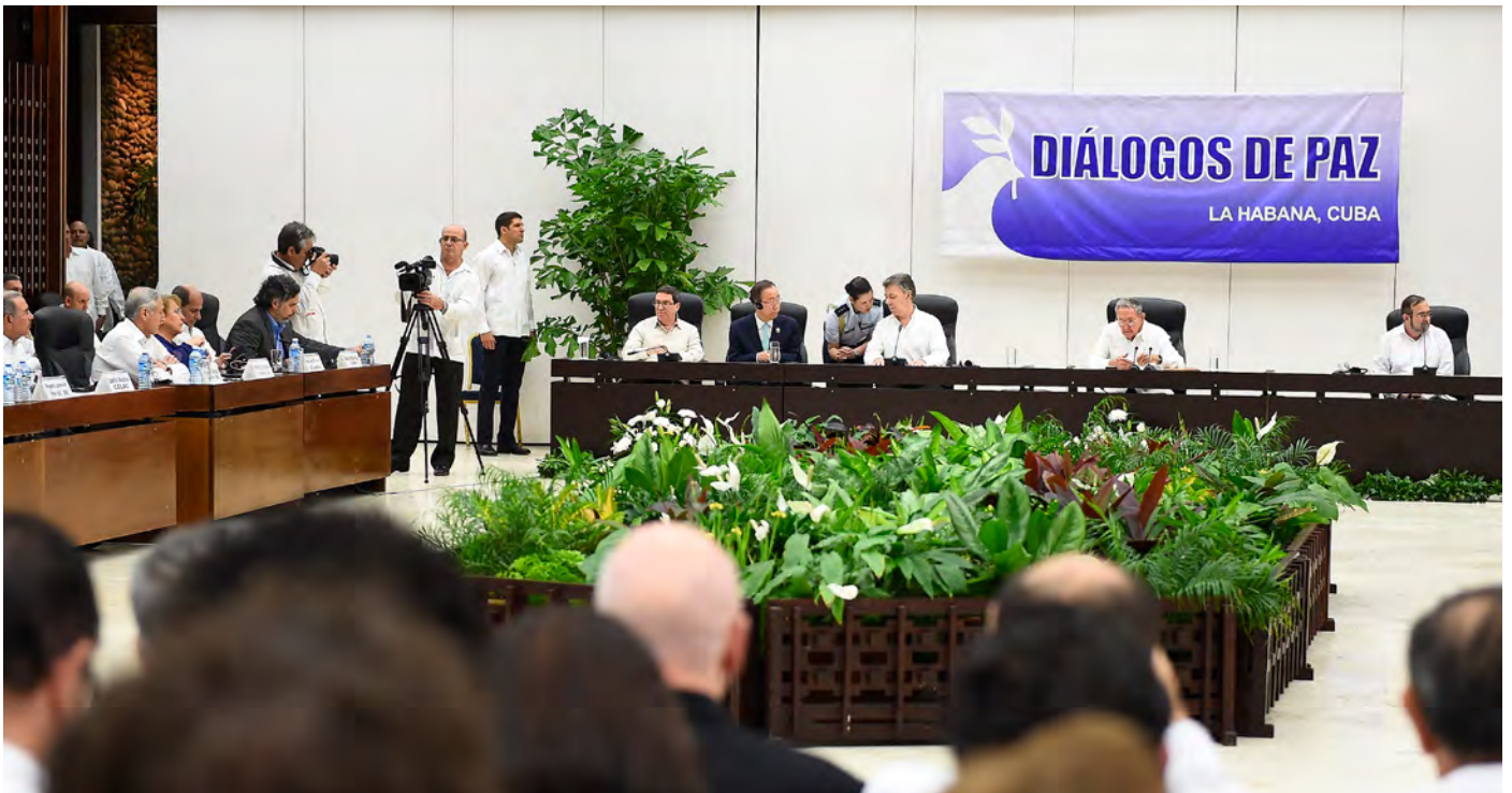
Vredesonderhandelingen tussen de Colombiaanse regering en FARC in Havana