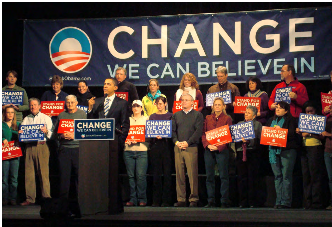
Het presidentschap van Barack Obama: evolutie of revolutie?

Een revolutie ontketenen staat daar niet bij.