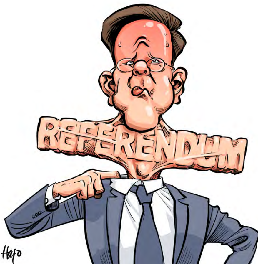
'Ze gaven wel toe dat hun eigen kennis op dat terrein tekort schoot' (Illustratie: Hajo, uit het boek De 100 beste cartoons )

flinker aan de weg timmeren gaan op excursie naar ProDemos, maar dat is een uitzondering, en sommige L&B-docenten ma-ken zelf lesmateriaal, maar dat kenmerkt zich veelal door een bescheiden omvang en door fouten en misverstanden over de parlementaire democratie en over de betekenis van grondrechten ('Vrijheid van meningsuiting betekent dat je mag zeggen en schrijven wat je wilt').