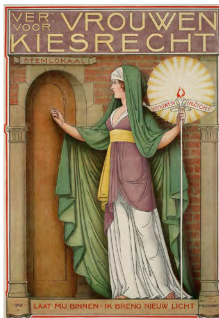
Affiche Vereeniging voor Vrouwenkiesrecht uit 1918 (illustrator: Theo Molkenboer / Wikimedia Commons)

Nadat de Franse legers in 1795 de Re- publiek hadden bezet en stadhouder Willem V naar Engeland was gevlucht, organiseerden veel Nederlandse steden plaatselijke verkiezingen. Overal werd over het doel van verkiezingen nage- dacht. Twee zienswijzen stonden daar-