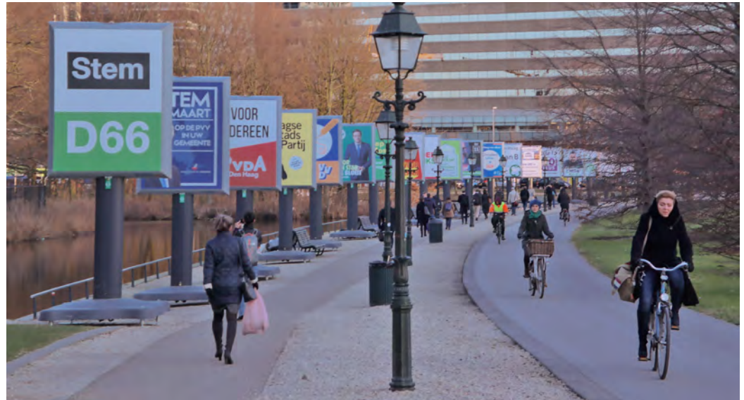
Campagneborden voor de gemeenteraadsverkiezingen 2018 in Den Haag