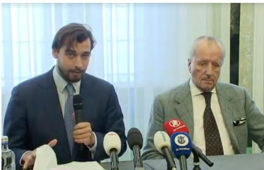
Thierry Baudet heeft aangifte gedaan wegens smaad

komst van onze kinderen en kleinkinderen. Omdat de oplossingen daarvoor echter niet eenvoudig en pijnloos zijn, werd het liever in het midden gelaten. Voor de gemeenteraadsverkiezingen worden natuurlijk de gevolgen van de decentralisatie van de zorg en sociale zekerheid naar de gemeenten gemeden. Nogal wat gemeenten hebben noch de kennis, noch de expertise, noch het geld om dat te behapstukken. Veel gemeenten hebben niet eens een functionerende onafhankelijke Rekenkamer. Toch hoor je daar in deze campagne vrijwel niets over. Volgens peilingen willen kiezers in bijvoorbeeld Amsterdam dat de verkiezingen over woningmarkt, de zorg, het onderwijs en het milieu gaan, maar net als met de Kamerverkiezingen van maart 2017 gaat het vooral weer over identiteit en integratie; onderwerpen waarover gemeenteraden niet eens kunnen gaan, want dat is allemaal landelijke politiek. Terwijl jij dit interview met mij doet, buitelt iedereen over elkaar heen vanwege de aangifte van Thierry Baudet tegen minister Kajsa Ollongren van D66, omdat die iets over Baudet's partij zei; terwijl Baudet's partij maar in één gemeente meedoet, namelijk Amsterdam.'