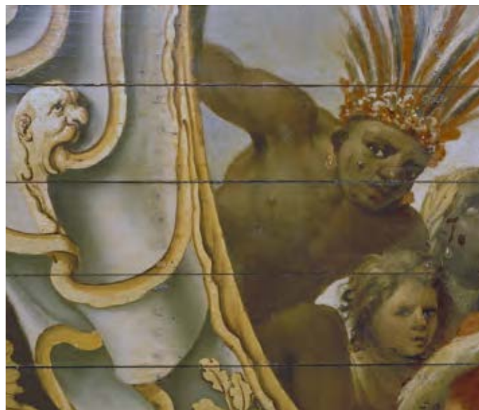
Plafondschilderingen in de Eerste Kamer: het volk kijkt mee

laterale beleidsafspraken en provincies daarmee voor min of meer voldongen feiten stellen.