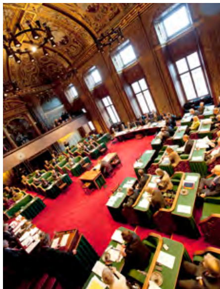
De vergaderzaal van de Eerste Kamer