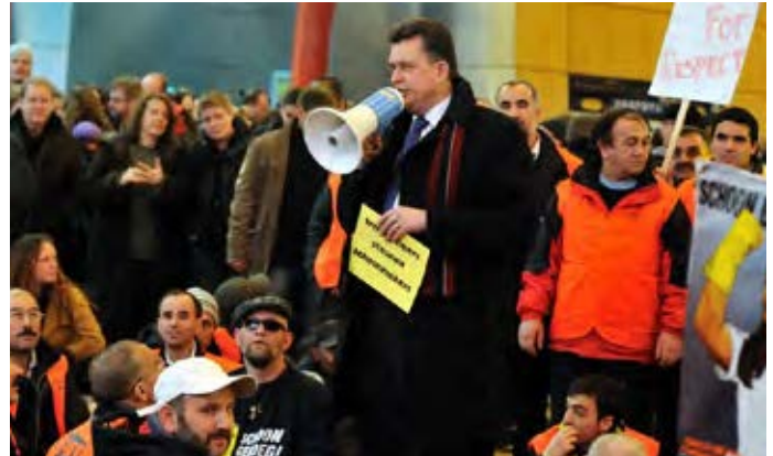
De band tussen sociale klassen en politieke voorkeur is niet meer vanzelfsprekend. (illustratie: Rob Nelisse/FNV Bondgenoten)

Om deze onderzoeksvraag te beantwoorden analyseerden wij bij 18.000 mensen uit achttien landen van de Europese Unie in hoeverre er een divergentie van klassen voorkomt en wat de gevolgen hiervan voor het stemgedrag zijn. Uit dit onderzoek blijkt dat wanneer mensen de keuze tussen arbeidersklasse , middenklasse of hogere klasse hebben ongeveer de helft zich met een andere klasse identificeert dan hun objectieve sociale klasse. Van diegenen die zich met een andere klasse identificeren schat iets meer dan de helft zichzelf in een hogere sociale klasse in en iets minder dan de helft vereenzelvt zich met een lagere klasse. Uit de resultaten komt naar voren dat deze divergentie een grote invloed heeft. Zowel bij een unidimensionale of algemene kijk op stemgedrag door middel van een algemene links-rechtsschaal als bij economisch stemgedrag is het zo dat de subjectieve sociale klasse van mensen een heel duidelijke predictor is van de electorale keuze die mensen maken. Bij cultureel stemgedrag werd geen invloed gevonden. Los van de werkelijke sociale klasse waartoe iemand behoort, vertonen diegenen die zich met de arbeidersklasse identificeren gelijke stempatronen. De subjectieve arbeidersklasse stemt namelijk beduidend linkser dan de middenklasse en de hoge klasse. Meer concreet: mensen met uiteenlopende beroepen als bediende, leerkracht, manager of dokter, maar met als gemeenschappelijke factor dat ze zich