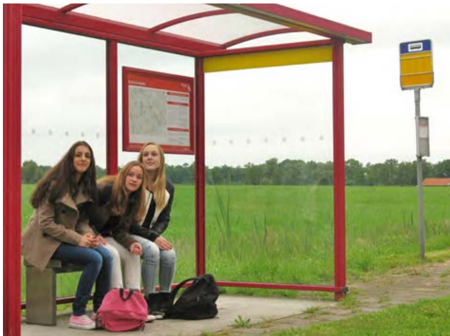
Een goede regionale bereikbaarheid is een belangrijke taak van de provincie

het onderhoud van verbindingswegen, tunnels en bruggen. Daarnaast bepaalt de provincie welke bedrijven het regionale bus- en treinvervoer in de provincie mogen verzorgen.