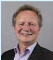
BRAM VAN OJIK (GROENLINKS)