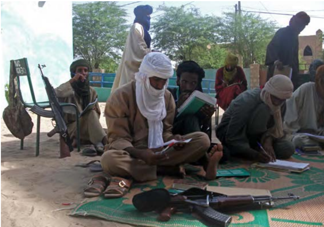
Internationale jihadisten ('blauwdrukutopisten') bereiden zich voor op de strijd in Mali