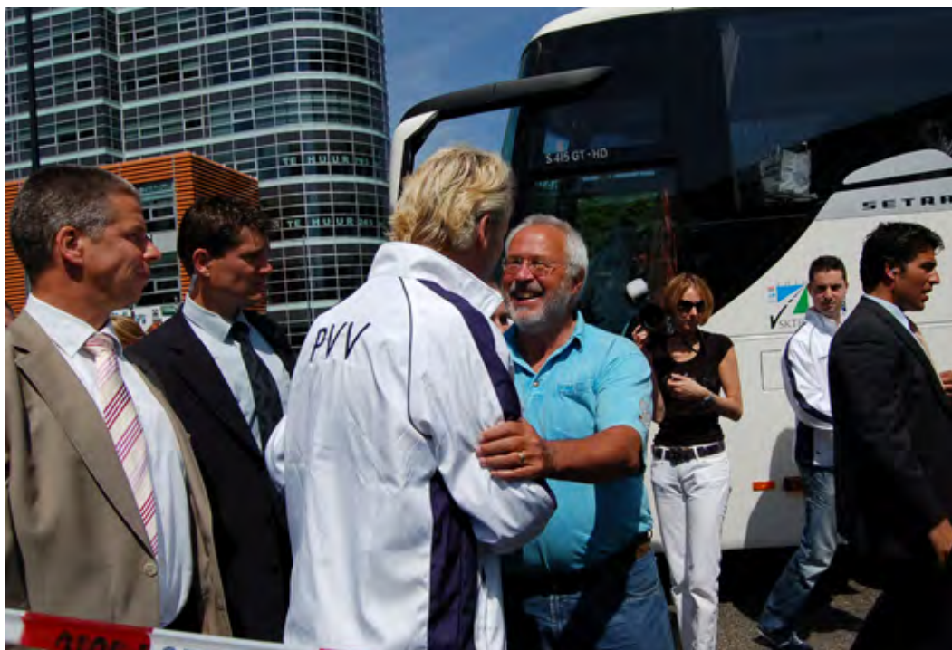
Geert Wilders en Ronald Sørensen