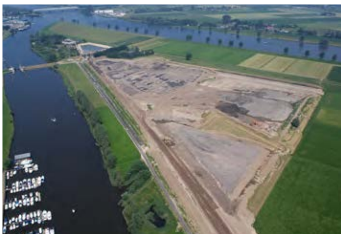
De Overdiepse Polder is één van de ruim dertig plaatsen waar het rijksprogramma Ruimte voor de Rivier het rivierengebied tegen overstromingen beschermt

N ederland kent 24 Waterschappen die alle een zelfde taak hebben: waterbeheer. Enerzijds zorgt het waterschap voor de aan- en afvoer van water, anderzijds voor de zuivering van rioolwater en voor het onderhoud van waterkeringen zoals dijken en duinen. Een aantal waterschappen beheert ook wegen, zoals fietspaden door polders, en vaarwegen.