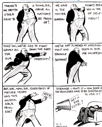
Bron: W.K. Haselden, in: Daily Mirror , 30 mei 1929. Ontleend aan: The Centre for the study of Cartoons and Caricature , GB.

hun districtskamerleden bijdragen - de laatsten zullen in het district zichtbaar moeten zijn om electoraal succes te behalen. Ook zal het bijdragen aan een revitalisering van de politieke partijen, die nu al hard op zoek naar goede districtskandidaten zijn. In feite is het voorstel voor een nieuw kiesstelsel in Nederland hiermee een bewuste poging om de verkiezingen in Nederland voor het electoraat aantrekkelijker te maken. Vergroting van de politieke betrokkenheid van de kiezers staat voorop.