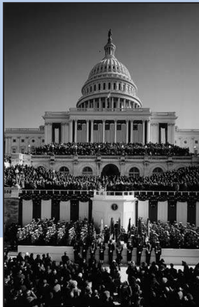
Dat smaakt naar meer... Inauguratie op Capitol Hill.

De Amerikaanse president heeft kritiek geuit op de hoogte van schadeclaims die burgers in rechtszaken - bijvoorbeeld tegen voor de aangerichte schade verantwoordelijke ondernemingen - kunnen krijgen toegevoerd. In sommige staten is al sprake van wettelijke maxima ( caps ). Sommigen vrezen dat een federale