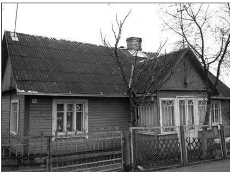
Schilderachtige plattelandswoning, wel vaak bouwvallig.

Voor wie bang is voor het verloren gaan van eigen taal en identiteit, onder invloed van de Europese Unie en het geweld van Hollywood en internet, biedt Litouwen een troostrijk voorbeeld. Dit land heeft zijn eigen identiteit en zelfbewustzijn volledig behouden, terwijl het van de laatste zeshonderd jaar nog geen veertig jaar als volledig onafhankelijke staat heeft gefunctioneerd. Nationale identiteit zit kennelijk diep. ■