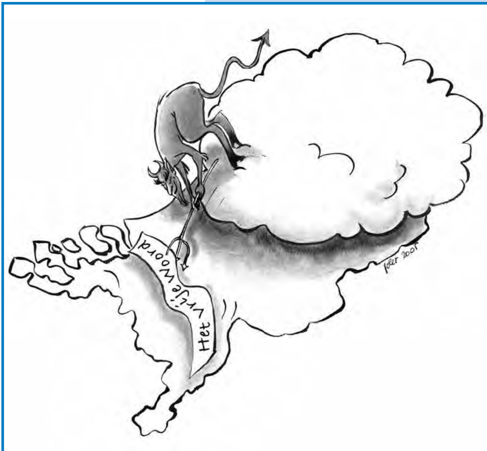
Illustratie: Joliet Leenhouts

Fortuyn heeft het grote zwijgen doorbroken en in zijn tegendeel doen omslaan. Een knappe prestatie, waarop niets hoeft te worden afgedongen. Hij beheerste de media