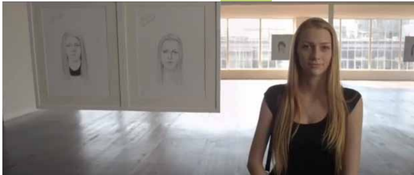
Dove-reclame: Je bent mooier dan je zelf denkt.