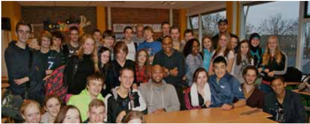
Schoolbezoek door de hoofdpersonen van Bandidos

gaat de burgermaatschappij met deze jongens om? Is het leger de ideale ontsnappingsroute voor jonge criminelen? Verschillende vmbo- en mbo-scholen nemen deel aan het educatieproject dat bij Bandidos hoort. De mannen uit de serie gaan op deze scholen in gesprek met (potentiële) kwetsbare jongeren over problemen en kansen. Het project richt zich voornamelijk op het vak maatschappijleer. Nog voor de eerste aflevering werd uitgezonden was de inschrijving al rond. Ook zonder dit educatieproject op scholen is het de moeite waard om een of meer afleveringen aan leerlingen op verschillende niveaus te laten zien. Op de website www.bandidosontour.nl staan lessuggesties waar fragmenten uit de serie bij horen. Voor havo en vwo biedt Bandidos voldoende mogelijkheden om er als docent zelf interessante opdrachten bij te verzinnen. ♦