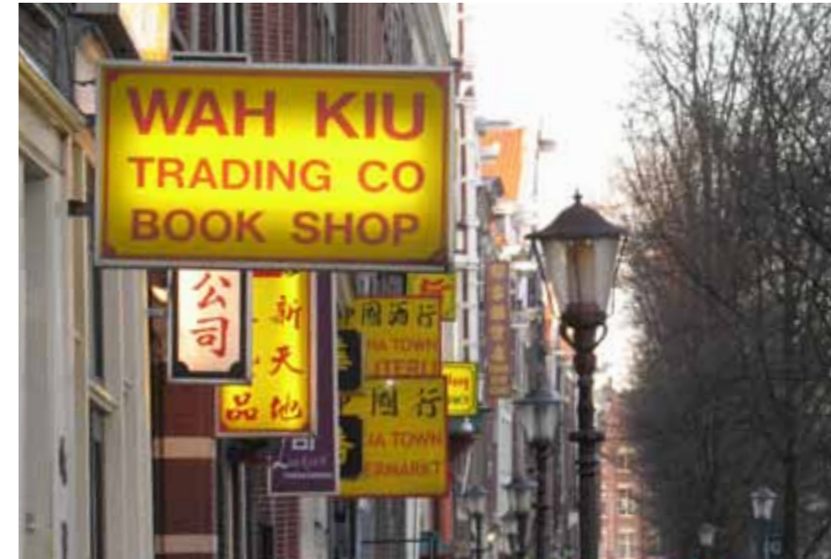
Mondialisering in Amsterdam

Kortom: het nationalisme van laaggeschoolden (hier: hun weerstand tegen migranten, vrijhandel en Europese eenwording)