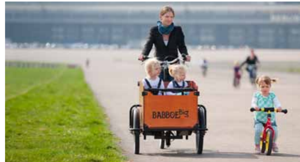
Een GroenLinks-kiezer met een bakfiets?

Zet vervolgens de stap naar hun eigen onderzoek: Ga naar