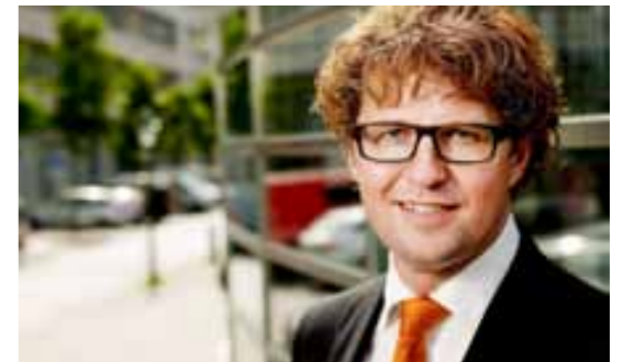
Staatssecretaris Sander Dekker

Ook de PvdA-fractie hecht aan het belang van burgerschapsvorming. 'Dat is ook de reden dat de PvdA-kamerleden Hamer en Dijsselbloem en het toenmalige LPF-Kamerlid Kraneveldt in 2006 samen een initiatiefwetsvoorstel hebben verdedigd dat scholen de verplichting oplegde om bij te dragen aan de integratie van leerlingen in de Nederlandse