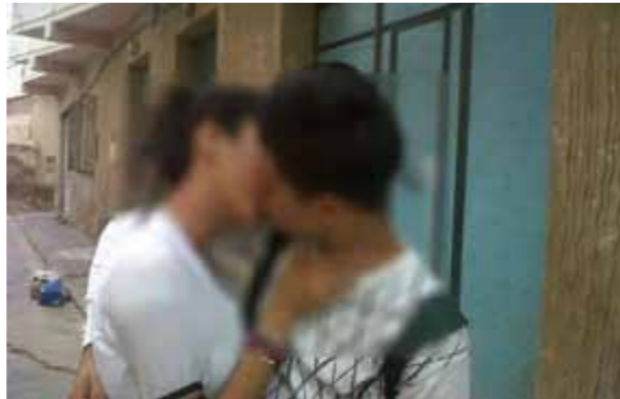
De Marokkaanse kus, zoals deze op Facebook is geplaatst

In elk dagblad zijn ze te vinden: kleine berichtjes van circa 75 woorden over de meest uiteenlopende onderwerpen. Deze berichten zijn binnen lessen maatschappijleer, maatschappijleer 2 en maatschappijwetenschappen goed te gebruiken. Zo kan het dienen als energizer (tijdens een blokkade even iets anders doen, of als er bijvoorbeeld nog tien minuten lestijd is te vullen), maar ook als bron voor vragen die met een behandeld hoofdstuk hebben te maken. Ook kunnen leerlingen met kleine berichten weer even laagdrempelig oefenen met begrijpend lezen en toepassen van lesstof op de praktijk van alledag: het nieuws.