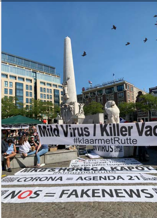
Amsterdam, september 2021