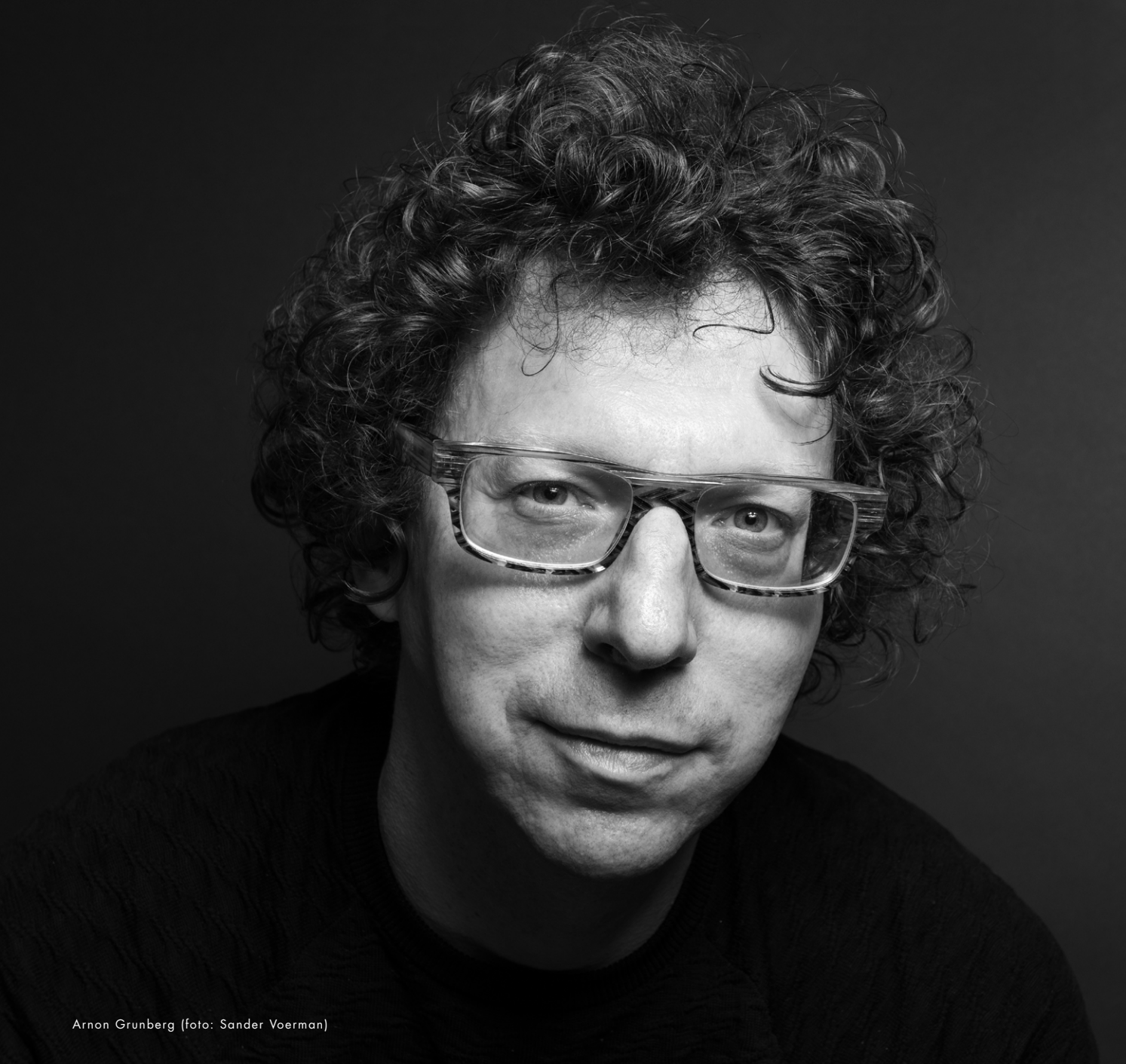
Arnon Grunberg