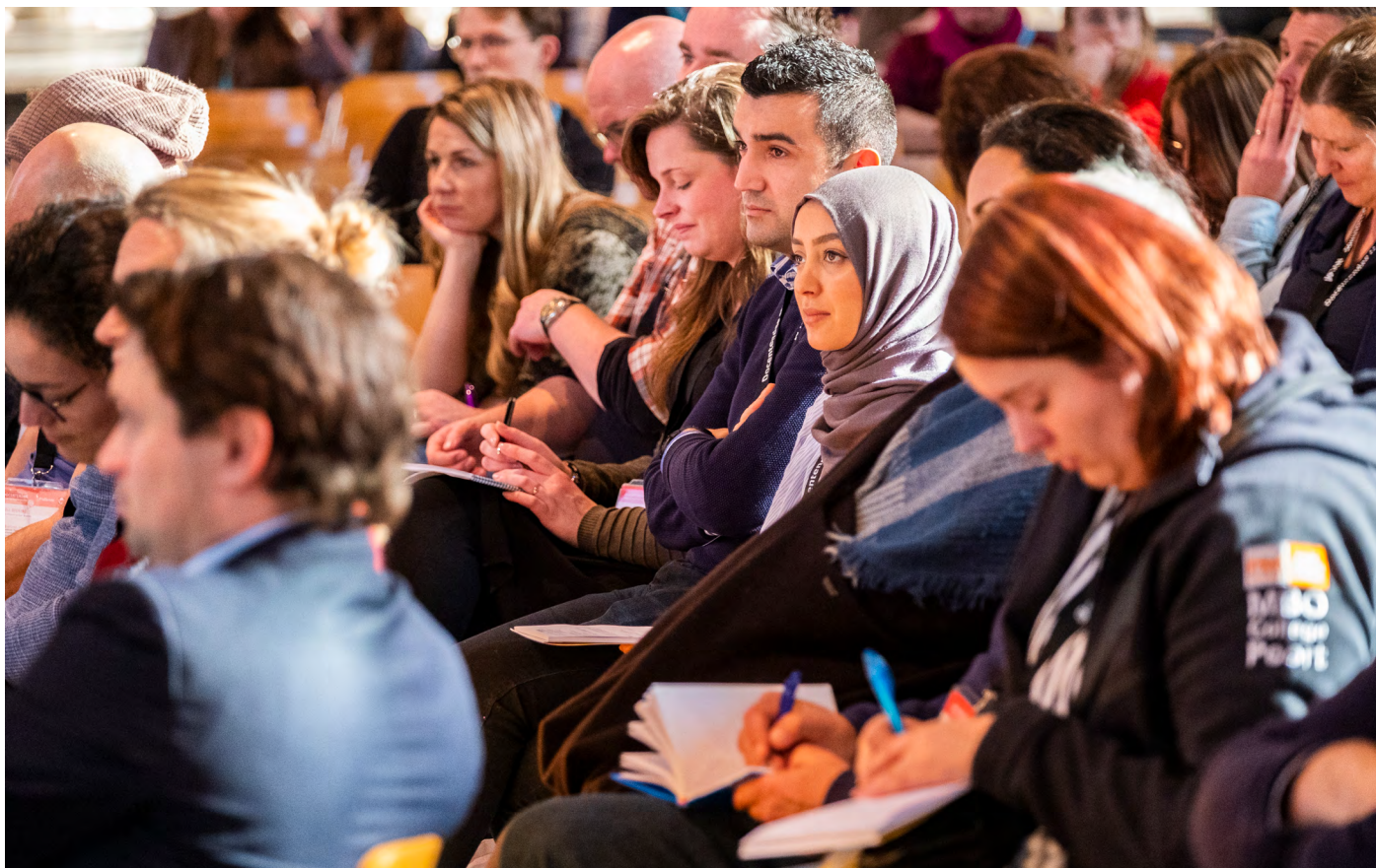
Tijdens de Docentendag zijn de docenten maatschappijleer meer dan zichtbaar. Waarom ziet ook de beroepsgroep leraren niet dat het belangrijk is om jezelf als sterk te positioneren?

de overheid afspreekt dat docenten ruimte hebben waar het schoolbestuur niet aan mag komen. Uiteindelijk heb je voor de verwerving van autonomie de overheid nodig. De beroepsgroep moet vraagtekens plaatsen bij de aversie die leraren tegen de overheid hebben. Bij de invoering van het lerarenregister namen we het BIG-register van huisartsen als voorbeeld. Het is gek dat je van je huisarts verwacht dat hij de op hoogte is van de laatste medische behandelingen, zodat je de beste behandeling krijgt, maar dat het voldoende is dat een leraar na het afronden van zijn opleiding voor de klas staat en alleen zo ervaring opdoet. Je wilt toch ook dat jouw kind het beste onderwijs krijgt? Je vak onderhouden is een publiek belang. Ik hoor ook weleens dat er wel degelijk bekwaamheidsonderhoud is: "Waarom zou je dit regelen?". Misschien is het er wel, maar wij zien het als overheid niet. Aan de buitenwereld kunnen we niet laten zien dat we met het publieke belang bezig zijn. Bij de advocatuur vereist de beroepsorganisatie dit om het vertrouwen in het beroep te houden. Je wilt niet dat er figuren tussen zitten die de naam advocaat dragen, maar het beroep beschadigen doordat ze te weinig vakkennis hebben.'