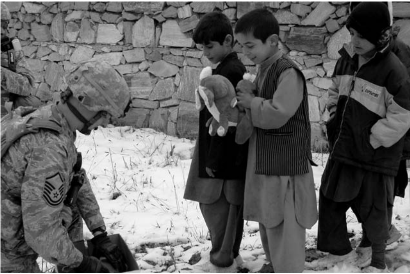
Afnemende onveiligheid: knuffelbeesten voor Afghaanse kinderen.

cratieën en voeren überhaupt minder oorlog;