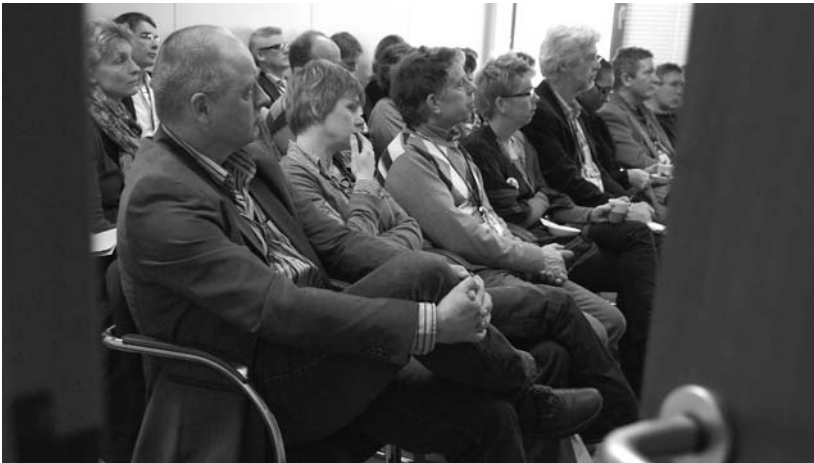
Publieke sociologie toegankelijker voor maatschappijleerpubliek.

gemaakt, maar dat het 'niet de bedoeling was om havo- en vwo-leerlingen al een inleiding op deze wetenschappen te geven' 2 . Pas in het voorstel van de Commissie Schnabel zijn voor het eerst de sociologische en politicologische kernconcepten als basis voor het vak genomen.