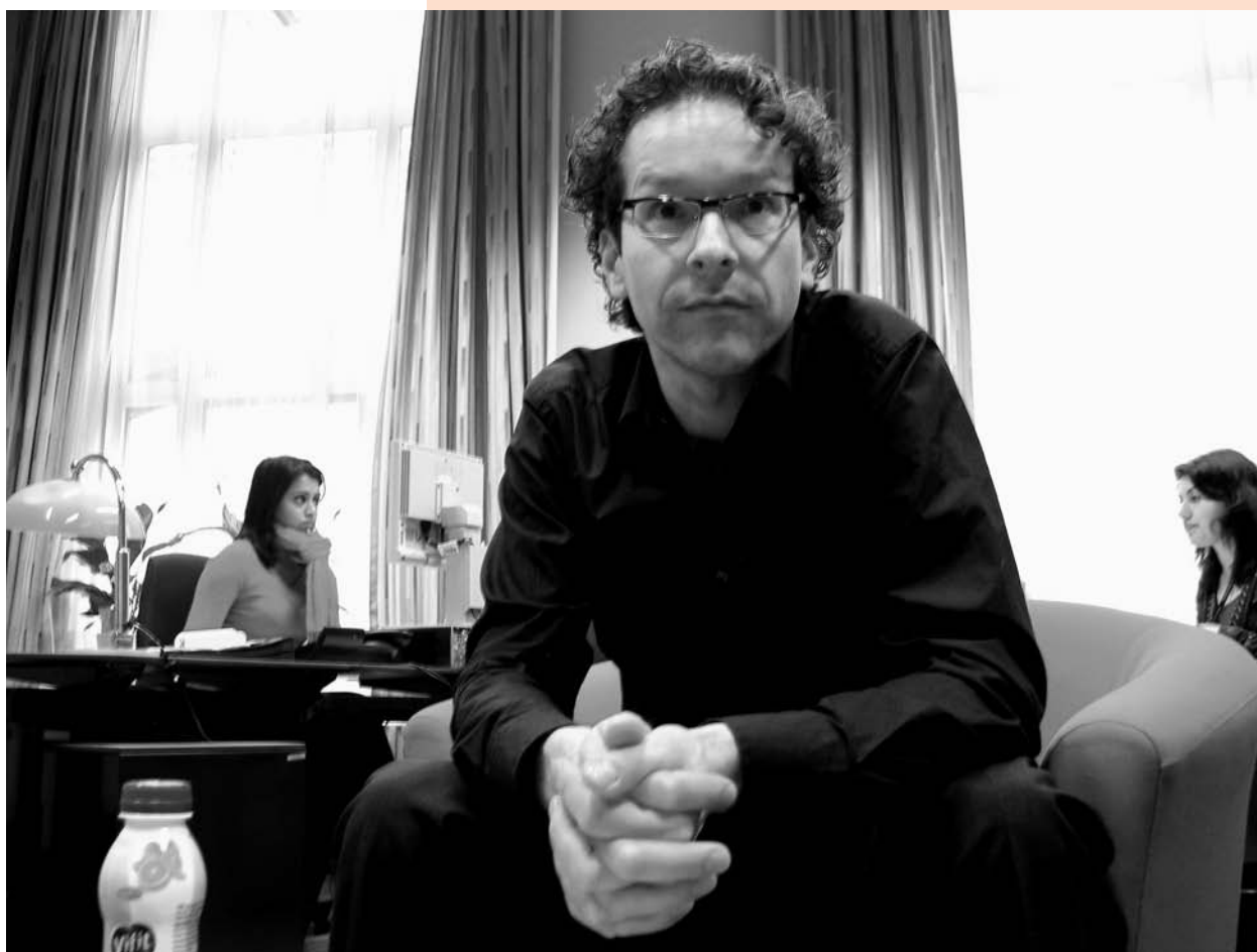
Commissievoorzitter Jeroen Dijsselbloem

We zijn geschrokken van pabo's waar studenten niet alleen hun eigen leerdoelen moesten formuleren, maar ook nog eens de manier waarop ze daar moesten komen! Zelfstandigheid heeft ook haar grenzen. Ze zitten niet voor