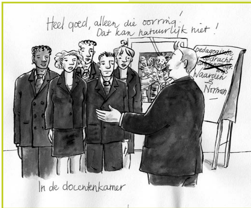
tekening: Jolet Leenhouts

huiswerk maken', maar voorbeelden van directe, concrete bijdragen zijn, volgens de Raad, schaars. Toch is de veronderstelling gerechtvaardigd dat aan abstracte waarden als 'democratische gezindheid', waarvan op zichzelf moeilijk aantoonbaar is hoe groot de vormende invloed van het onderwijs is, in de vorm van het leren argumenteren en discussiëren wel degelijk een belangrijke bijdrage wordt geleverd. Die bevatten immers ook het aanleren van het laten uitpraten van anderen en het tolereren van andere opvattingen. Overigens steekt het Nederlandse onderwijs, met betrekking tot de aandacht voor vaardigheden als argumenteren en discussiëren, tamelijk negatief af bij omringende landen.