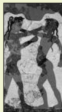
'Stomptraining in de Oudheid'.

Leerkrachten en management worstelen met de problematiek van waarden en normen, met het opstellen en, meer nog, het handhaven van regels, met intimidatie, bedreiging en agressie. Anders dan enkele decennia geleden hebben scholen te maken met een leerlingenpopulatie uit milieus waarbinnen een grote diversiteit aan opvoedingsstijlen voorkomt. Het gevolg hiervan zijn de sterk uiteenlopende attitudes van leerlingen en ouders ten aanzien van schoolregels en de sancties ter hand-