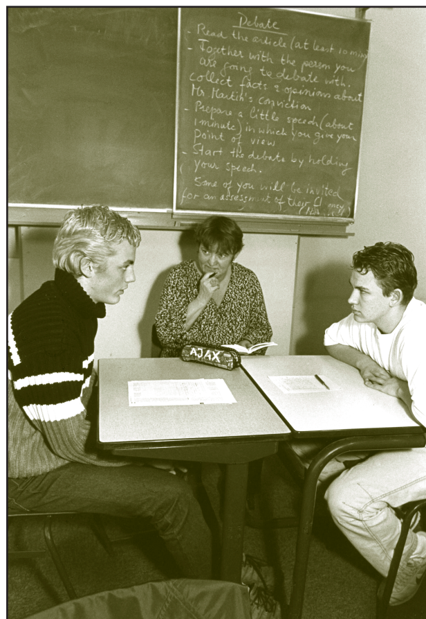
Docent als conflictbemiddelaar (Foto: Mieke Schlaman).

Op basis van dat inzicht zijn trainingen ontworpen die leerkrachten kunnen leren adequaat te reageren in situaties die door uitingen van agressie worden gekenmerkt. Een overzicht: