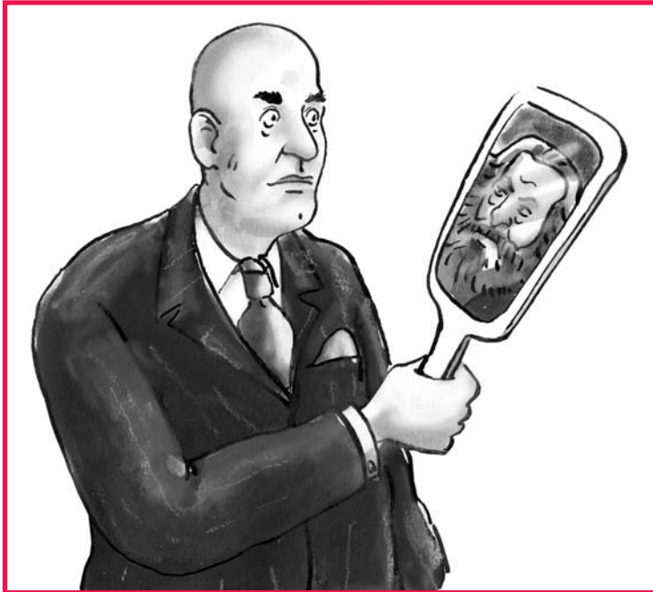
Illustratie: Joliet Leenhouts

Overigens, en geheel voor rekening van schrijver dezes, verklaart dat wellicht ook waarom bijvoorbeeld het SP-jargon niet alleen op de taal van de marxistische Pim lijkt, maar soms ook op die van de LPF-Pim.