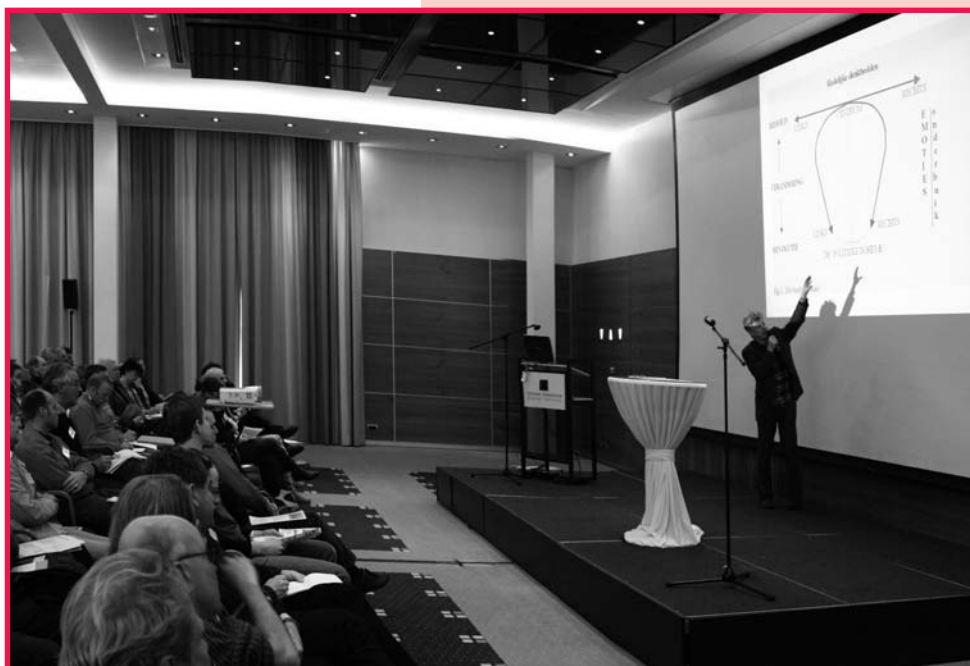
Dick Pels verklaart zijn hoefijzermodel.

te beschouwen, maar als men naar feitelijke standpunten kijkt, reist het populisme langs de hele spectrumlijn.