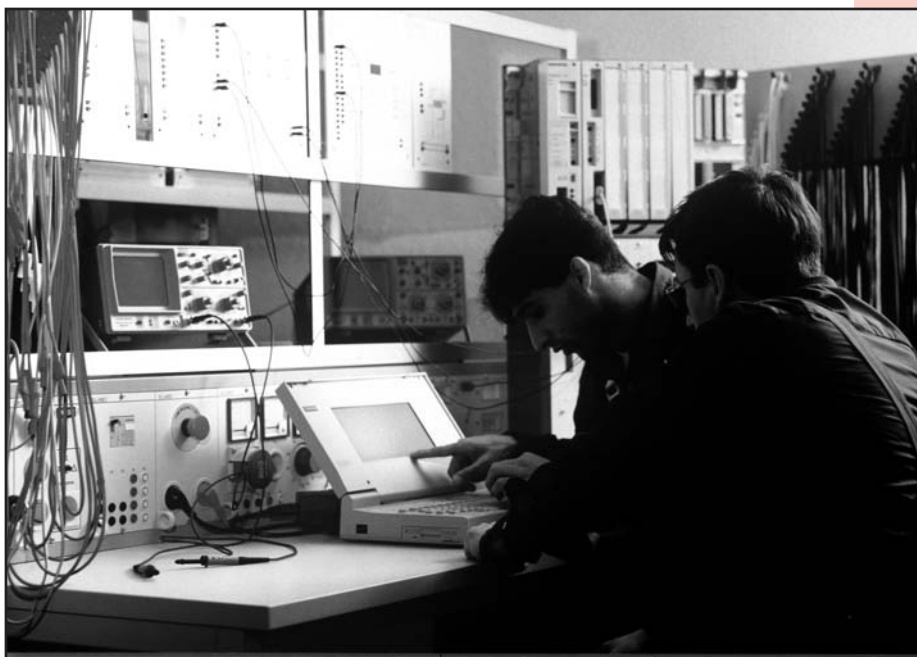
Leidt kenniseconomie niet tot sociale ongelijkheid?

werkloosheid toegenomen. Een percentage van 23 procent werkloosheid bij niet-westerse allochtone jongeren is voor Nederland ongekend hoog. De koopkracht per huishouden is na 2002 gedaald. De inkomensongelijkheid leidt dan ook tot een scheve verdeling van het sociale en culturele kapitaal in een samenleving en een toename van een gevoel van onzekerheid en onveiligheid, met name onder de groepen die er sterk op achteruit zijn gegaan. Dat het ook anders kan, laat de situatie in Finland zien.