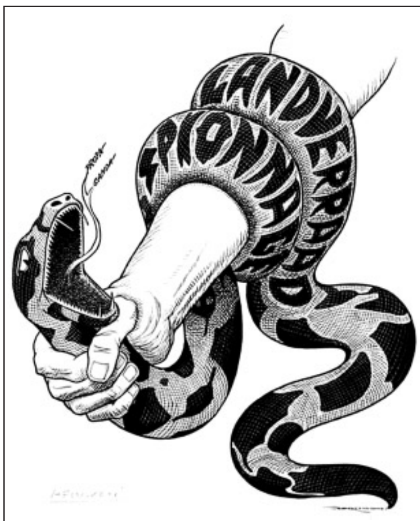
Propaganda met propaganda bestreden.

Beeldmateriaal in de vorm van reclame, cartoons en propaganda is zeer geschikt voor analyse. Het draagt een versimpelde kijk op de wereld uit en maakt gebruik van stijlmiddelen die eenvoudig zijn te herkennen. Leerlingen voelen zich, zeker als het betrekking op de actualiteit heeft, vaak direct aangesproken. Dit wil niet zeggen dat zij hierdoor de betekenis van het afgebeelde altijd goed interpreteren. Kijken is niet altijd zien. Mijn ervaring is dat leerlingen en studenten, bijvoorbeeld bij de analyse van cartoons, vrij oppervlakkig kijken. Allerlei beeldinformatie in de vorm van symbolen en stijlfiguren (paradox, ironie) worden niet als zodanig herkend. Gebrek aan voorkennis wordt door leerlingen en studenten verhuld door naar de betekenis te gissen. Dit levert overigens vaak prachtige associaties en sterke verhalen op. Voor het goed duiden van afbeeldingen is geletterdheid in combinatie