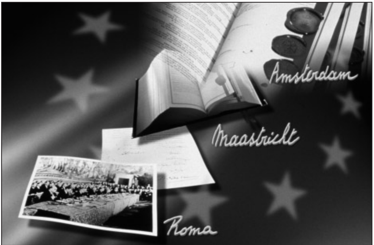
EGKS, Europese Unie... Republiek Europa?

Norwegen, Zwitserland en IJsland komen de definitieve grenzen van de Republiek in zicht. Er woedt in 2030 een levendig debat over de vraag of de Republiek klaar is voor onderhandelingen met de laatste drie toetredingskandidaten: Wit-Rusland, Oekraïne en Moldavië.