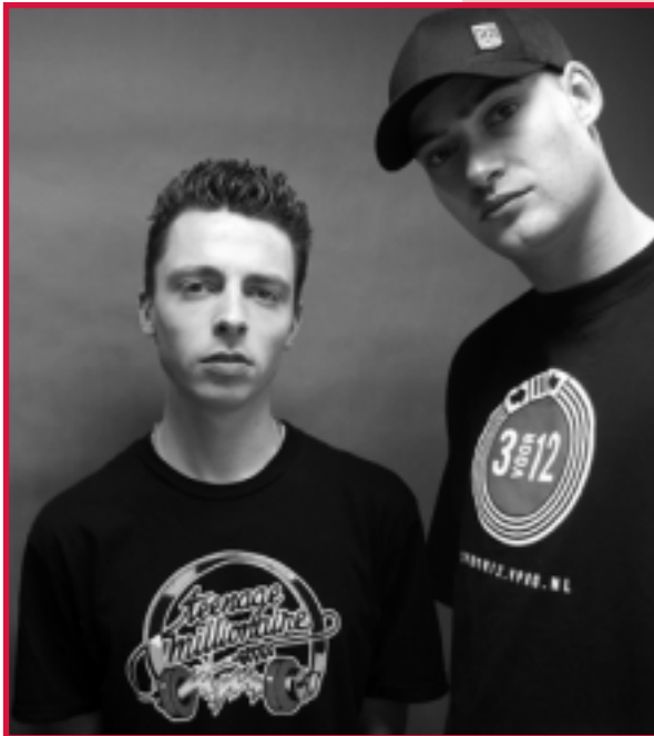
Lange Frans (rechts) & Baas B.

Lange Frans & Baas B zijn Nederlands bekendste en succesvolste rappers. Regelmatig staan ze in de hitlijsten. De raps gaan over de meest uiteenlopende zaken in het leven van de jongemannen en de teksten zijn ongecensureerd, maar het duo is zich goed bewust van de voorbeeldfunctie die het vervult. Naast de titels uit hun stoere-mannen-repertoire schreven ze een aantal raps waarin maatschappelijke problemen worden aangekaart. Zinloos – de Theo van Gogh-versie over zinloos geweld is daarvan een goed voorbeeld.