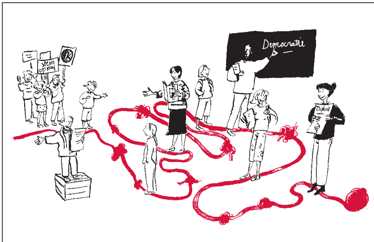
Illustratie: Joliet Leenhouts

In de bovenbouw krijgt dit voor alle leerlingen een vervolg bij het vak Maatschappijleer: op het vmbo bij het domein Macht en Zeggenschap, op havo/vwo bij het domein Parlementaire Democratie (nieuw examenprogramma 2007) of Politieke Besluitvorming (Maatschappijleer 2). Leerlingen die een maatschappijprofiel kiezen, krijgen ook nog een vervolg bij het verplichte profielvak Geschiedenis, met daarin aandacht voor geschiedenis van de rechtsstaat en parlementaire democratie en voor kenmerkende aspecten van de inrichting van het bestuur en de verdeling van macht in de diverse tijdvakken. Veel onderdelen hebben dus betrekking op hetzelfde kernconcept. Voor leerlingen en docenten is dit echter