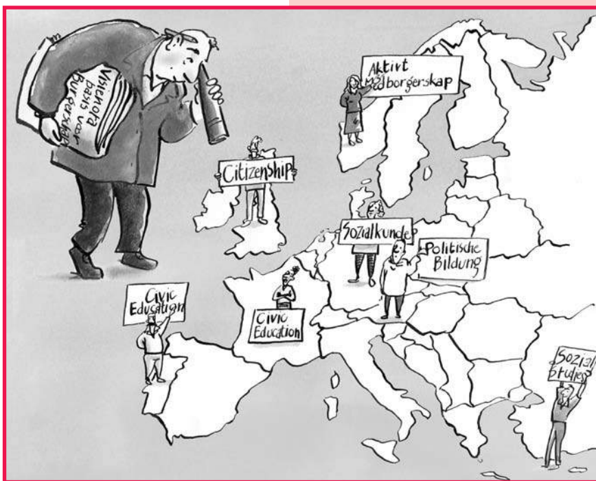
Illustratie: Jolet Leenhouts

zelf. De Nederlandse minister van Onderwijs Maria van der Hoeven heeft recent bij wet burgerschap en integratie in de kerndoelen van primair en voortgezet onderwijs laten opnemen. Zij heeft Stichting Leerplanontwikkeling (SLO) opdracht gegeven een leerplankader burgerschapsvorming voor primair en voortgezet onderwijs te ontwikkelen. Op 28 maart jongstleden is een visie-