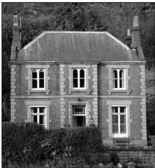
Our house.

de lerarenopleiding van de Noordelijke Hogeschool Leeuwarden in de Friese hoofdstad is uitgevoerd.