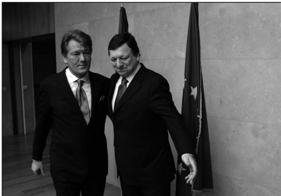
President Joestsjenko (links) wordt ontvangen door Europese Commissievoorzitter Barroso.

Dankzij de Oranje Revolutie kon Viktor Joesjtsjenko democratisch tot president worden gekozen, met de belofte van een oriëntatie op de Europese Unie. Dat leidde tot applaus in het Westen, maar wat koopt Oekraïne daarvoor? Geen lidmaatschap, zelfs op de lange termijn valt niet goed in te zien hoe dit zijn beslag zou moeten krijgen: een schouder-