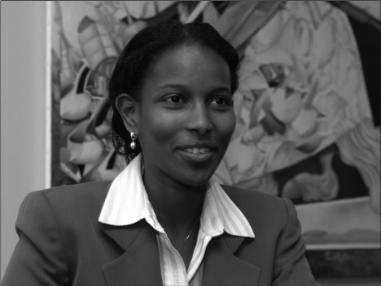
Ayaan Hirsi Ali, voor een goed debat in de klas

concreet maatschappelijk vraagstuk te analyseren. Mijn lessenserie wordt rondom de 'affaire-Hirsi Ali' opgebouwd. Dit is een bruikbaar maatschappelijk vraagstuk omdat het veel aandacht in de media heeft gehad. Veel leerlingen zullen zich de Tweede Kamerdebatten over het paspoort van Ayaan Hirsi Ali herinneren, en hopelijk plaatsen de makers van Teleblik ( www.teleblik.nl ) op korte termijn een aantal spannende beelden uit deze debatten op hun internetpagina. De introductie van deze kwestie in de klas zal in elk geval niet saai zijn: de Tweede Kamer en minister Rita Verdonk van Integratie en Vreemdelingenzaken gaan door tot in de kleine uurtjes, VVD-vice-premier Gerrit Zalm moet achter zijn televisie vandaan komen om tekst en