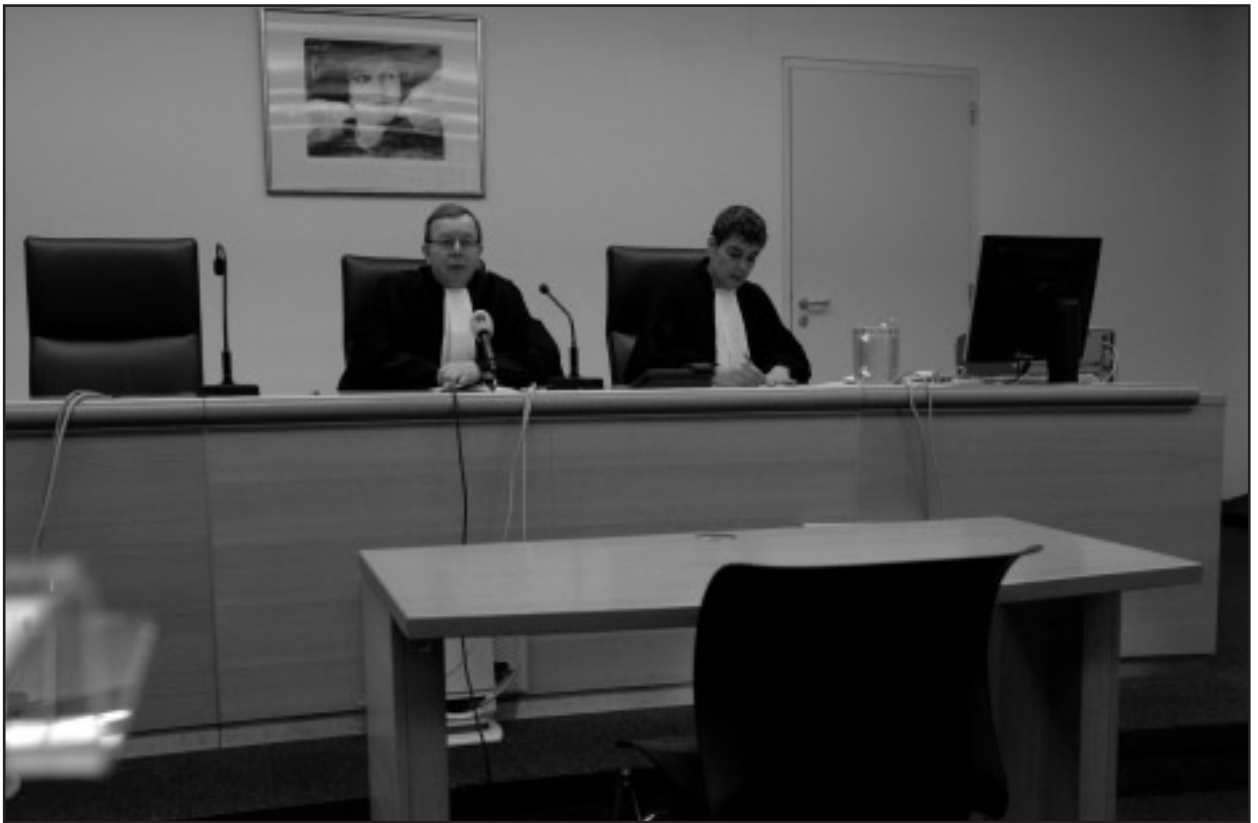
Gerechtelijke procedure buiten bereik van leraar

conflicten met de burens en ruzies over betalingen. Zo kan het zijn dat u bij terugkeer van een buitenlands verblijf van enkele jaren ontdekt dat uw huis een kamer kleiner is geworden. De burens aan wie u de zorg voor uw woning had toevertrouwd, hebben een scheidingwand doorgebroken en de deur van de betrokken kamer naar uw overloop dichtgemetseld. Alles ziet er prima uit en over getuigen beschikt u niet. De vers gepleisterde muur loopt wat vreemd, maar dat was een avontuurlijke streek van de moderne architect, volgens de vertrouwenuitstralende buurman. Zo wordt het een civiele zaak; u beweert dit, de buurman dat, kortom: geen zaak voor de politie. Als voorbeeld van de afhandeling van zo'n civielrechtelijk conflict tussen burens heeft u mogelijk de televisierubriek Rijdende rechter