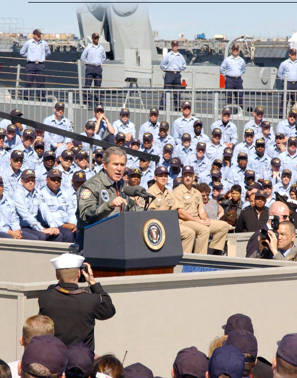
'Als je niet voor ons bent, dan ben je tegen ons', de Amerikaanse president George W. Bush tijdens de War on Terror.